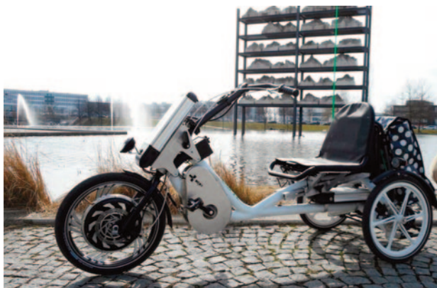
Beispiel für ein klassisches Elektro-Dreirad oder E-Trike

Nicht gefördert werden elektrische, medizinische (Kranken-) Fahrstühle, auch solche im Sinne der Krankenkassen, sowie selbstfahrende drei- und vierrädrige E-Fahrzeuge, sogenannte ‚Caddys‘.